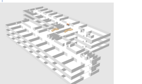
Plesso SUCCURSALE Cosmai